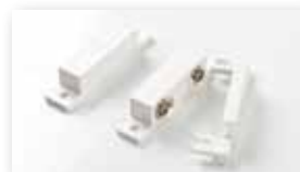
Dørkontakt (Trådløs dørkontakt er under udvikling.)