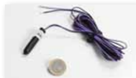
Temperaturføler. (Trådløs temperaturføler er under udvikling.)